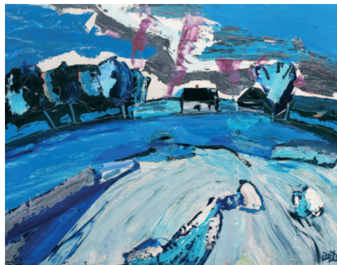
“Šķūniši” (1987. gads)