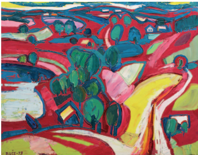
“Bez nosaukuma” (1973. gads)