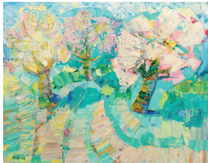
“Ābeles” (1974. gads)